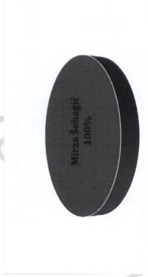
Vlasnička struktura prije i nakon mjera restrukturiranja

Tvrtka VALLERA d.o.o. je u 100%-tnom privatnom vlasništvu, a vlasnik je Mirza Šehagić. Nakon restrukturiranja vlasnička struktura tvrtke neće se mijenjati. U nastavku se nalazi grafički prikaz vlasničke strukture prije i nakon mjera restrukturiranja.